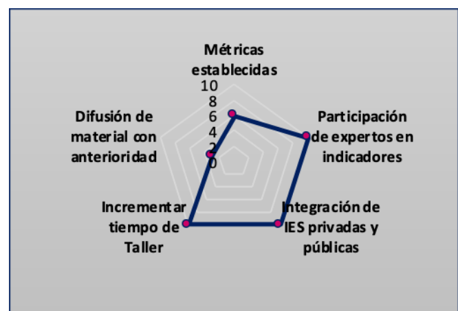
Figura 3. Recomendaciones para el proyecto

En la Figura 3, las recomendaciones principales y con mayor puntaje (10) son: 1) la participación de expertos en indicadores, es decir que para tener una mejor validación del catálogo se debe considerar la presencia de gremios especializados en indicadores, así como la de áreas directivas y aportación de expertos relacionados a cada dimensión de los indicadores; 2) la integración de IES públicas y privadas, hacen que el proyecto tenga una visión más real y se amplíe el alcance del proyecto, no solo para instituciones públicas si no para las privadas y que se vaya tomando en cuenta la realidad que tiene cada una.